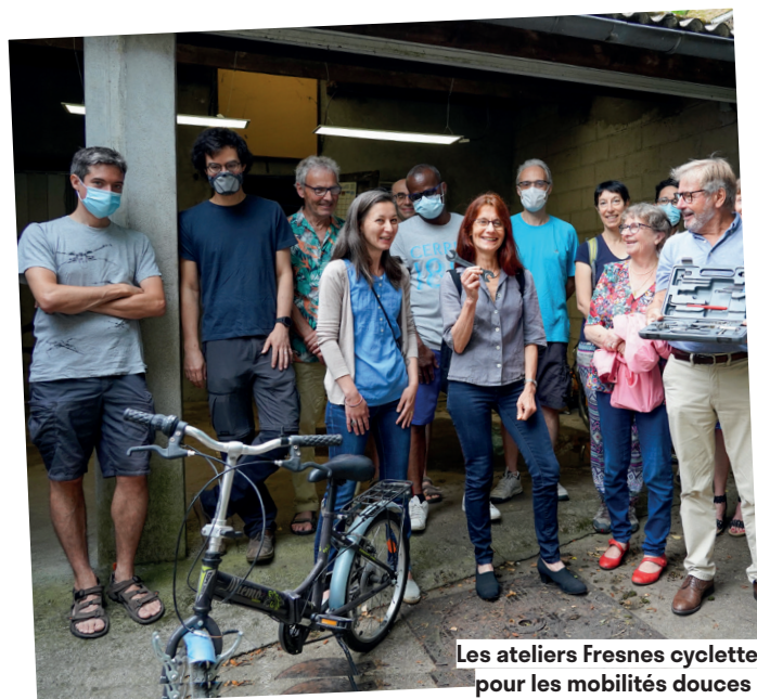
Les ateliers Fresnes cyclette, pour les mobilités douces !