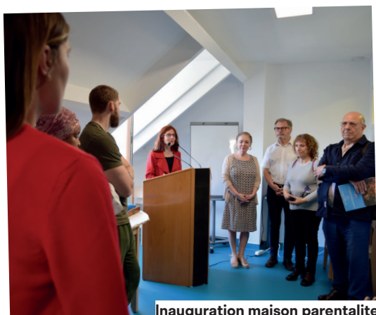
Inauguration maison parentalité

Cette gestion rigoureuse, reconnue par la Chambre régionale des comptes, nous permet aujourd'hui de financer les grands projets en cours : la rehabilitation du groupe scolaire Berthy Albrecht, la rénovation de la place Pierre-Marie Curie, le programme Centre-ville vivant et le second doublet de géothermie. Ces chantiers, déjà engagés, sont les fondations du Fresnes de demain.