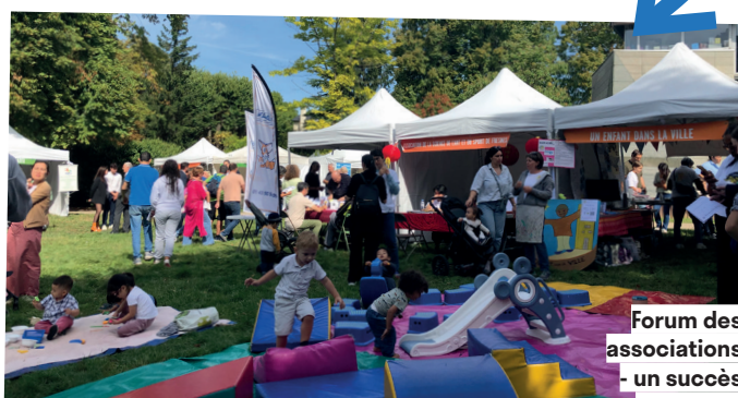
Forum des associations - un succès renouvelé