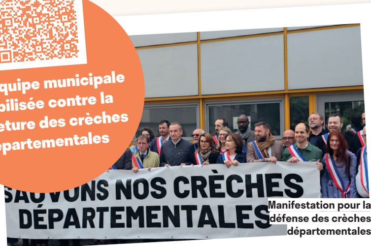
Manifestation pour la défense des crèches départementales

Une équipe municipale mobilisée contre la fermeture des crèches départementales