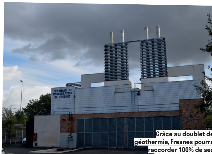
Grâce au doublet de géothermie, Fresnes pourra raccorder 100% de ses logements collectifs