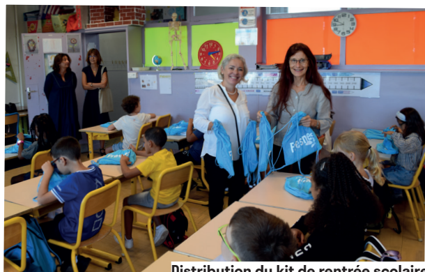
Distribution du kit de rentrée scolaire