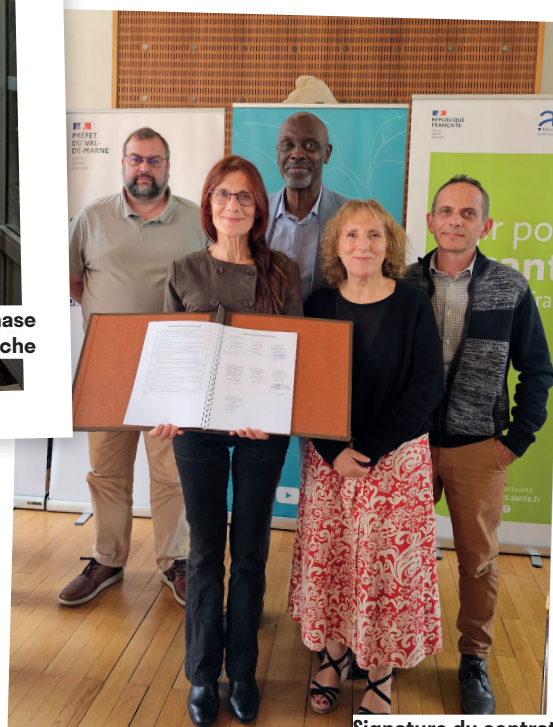
Signature du contrat local de santé