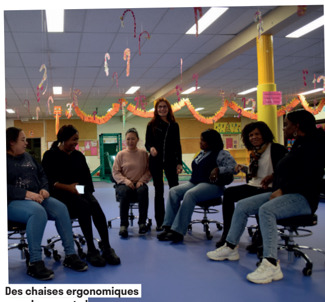
Des chaises ergonomiques pour les agents !

Face à une crise sanitaire d'une ampleur inédite, la Ville de Fresnes s'est immédiatement organisée pour répondre à l'urgence, protéger les habitantes et habitants, soutenir les plus fragiles et assurer la continuité du service public.