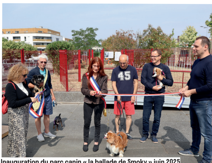
Inauguration du parc canin « la ballade de Smoky » juin 2025