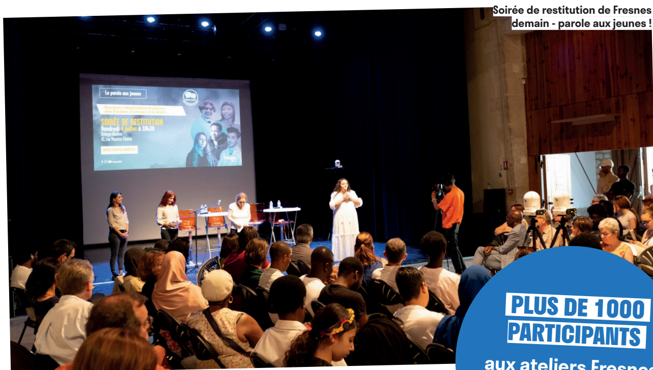
Soirée de restitution de Fresnes demain - parole aux jeunes !

Ces échanges ont conduit à la rédaction de deux cahiers d'engagements , à l'hiver 2024 puis à l'été 2025, qui traduisent les attentes des habitantes et habitants en véritables orientations municipales . Ces engagements sont aujourd'hui en cours de mise en œuvre . Avec le caniparc, le terrain de basket 3X3, les touches de couleurs sur les poteaux à proximité des écoles ou des tables d'échec, les Fresnoises et les Fresnois peuvent désormais profiter des projets portés dans le cadre du budget participatif.