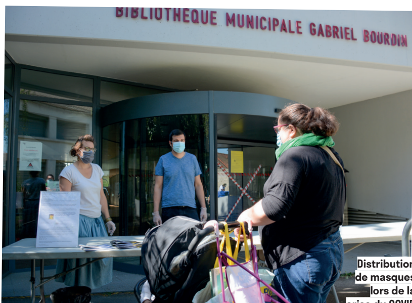
Distribution de masques lors de la crise du COVID