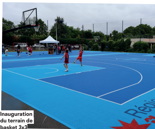
Inauguration du terrain de basket 3x3