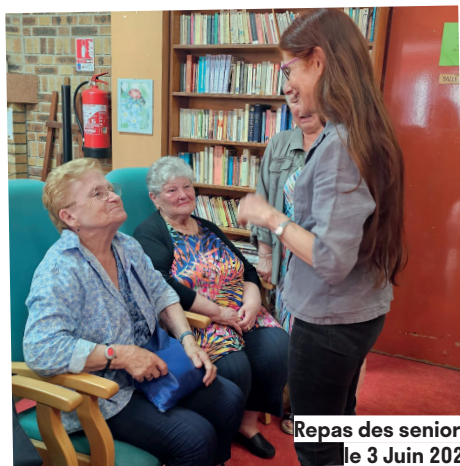
Repas des seniors, le 3 Juin 2025