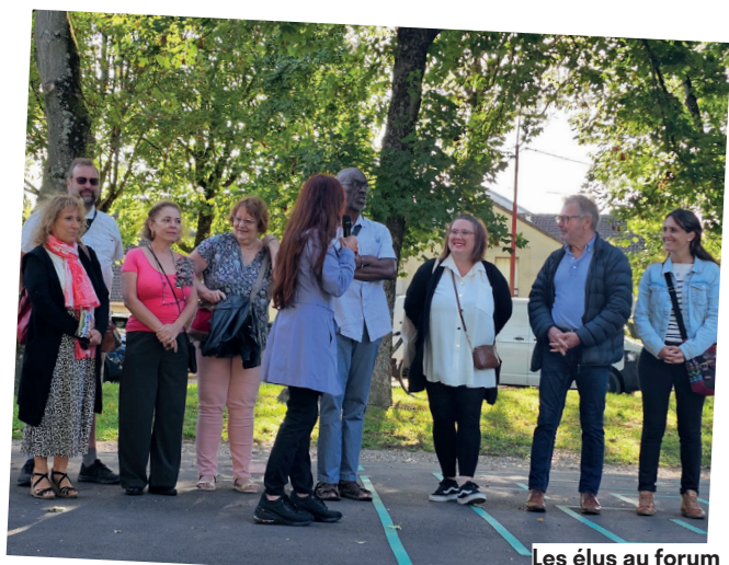
Les élus au forum des associations