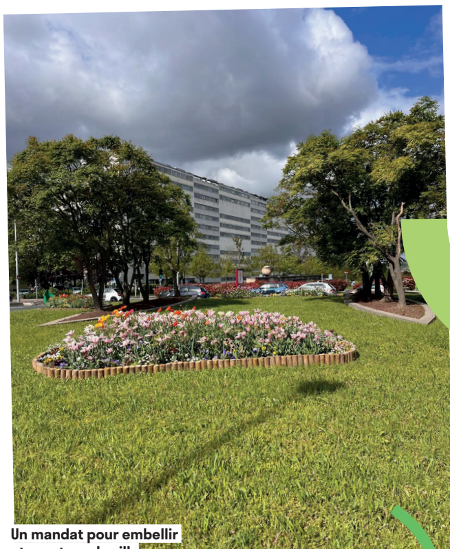
Un mandat pour embellir et renaturer la ville

C'est l'objet de notre charte de la construction durable et de la révision profonde des règles depuis 2017 : limitation de l'emprise au sol, suppression des hauteurs dérogoires, interdiction des immeubles en fond de parcelle pour protéger la trame verte et la qualité de vie.