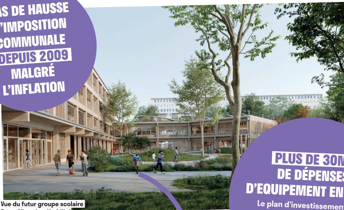
Vue du futur groupe scolaire Berty Albrecht réhabilité

PAS DE HAUSSE D'IMPOSITION COMMUNALE DEPUIS 2009 MALGRÉ L'INFLATION