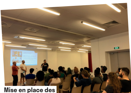
Mise en place des ateliers logements