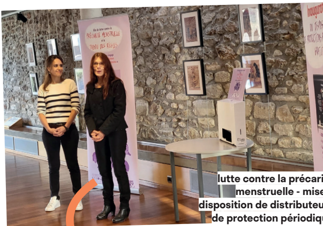
Lutte contre la précarité menstruelle - mise à disposition de distributeurs de protection périodique